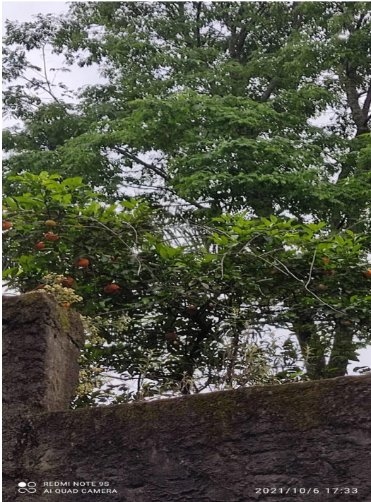
Figura 6: Exemplar adulto de Citrus × limonia -Francisco Beltrão, Paraná, Brasil.