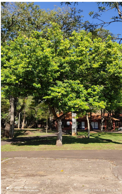
Figura 7: Exemplar adulto de Nectandra megapotamica -Francisco Beltrão, Paraná, Brasil.