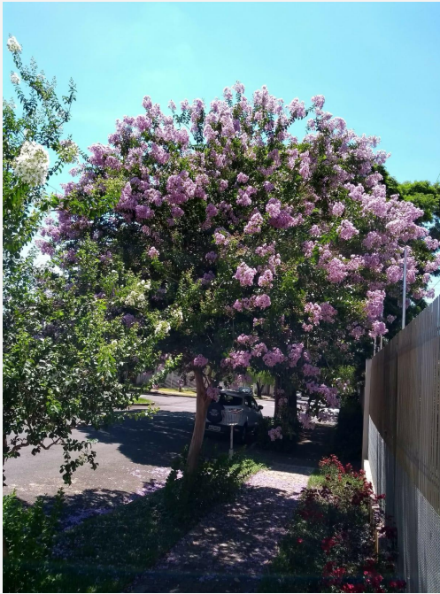
Figura 10: Exemplar adulto de Lagerstroemia indica - Francisco Beltrão, Paraná, Brasil.