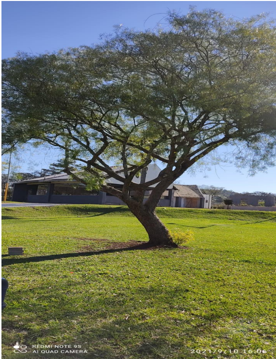
Figura 2: Exemplar adulto de Salix babylonica -Francisco Beltrão, Paraná, Brasil.