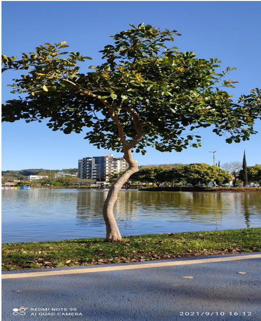
Figura 1: Exemplar adulto de Psidium cattleianum -Francisco Beltrão, Paraná, Brasil.