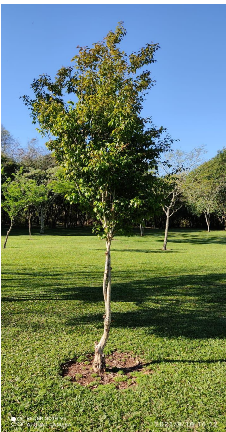
Figura 5: Exemplar adulto de Eugenia uniflora L. -Francisco Beltrão, Paraná, Brasil.