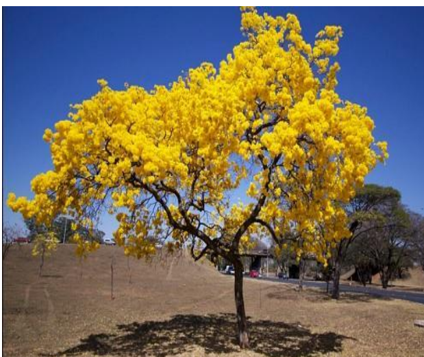
Figura 3: Exemplar adulto de Tabebuia Alba

Fonte: https://www.plantaseraizes.com.br/ipe-amarelo-e-seus-beneficios/