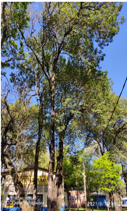
Figura 8: Exemplar adulto de Ligustrum lucidum -Francisco Beltrão, Paraná, Brasil.